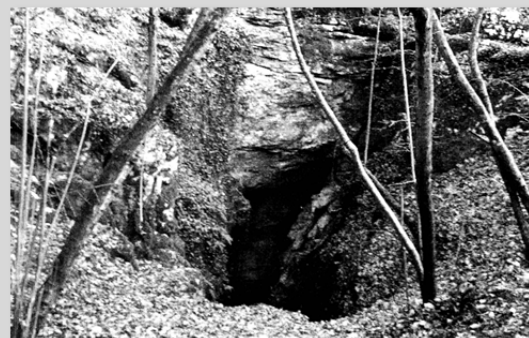
una foiba oggi