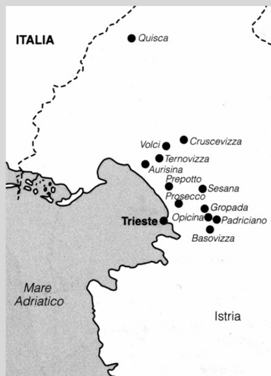
le foibe del maggio 1945