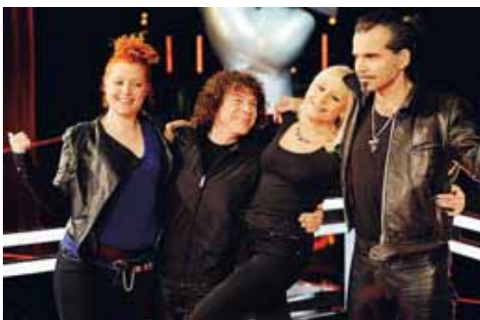
In alto, da sinistra: Noemi, Riccardo Cocciante, Raffaella Carrà e Piero Pelù

MILANO - «È un programma diverso dai talent e qui l'immagine non conta». L'idea che i coach del format The voice of Italy , Raffaella Carrà, Riccardo Cocciante, Piero Pelù e Noemi vogliono dare del programma in partenza domani su Rai2, è quella di un qualcosa di diverso dei talent show ai quali la televisione ha abituato il pubblico nell'ultima manciata di anni. I quattro, che ci tengono ad essere definiti coach e non giudici, ieri hanno incontrato la stampa a Milano, nello studio Rai di via Mecenate dal quale andrà in onda la versione italiana del format televisivo di origini olandesi che già ha fatto registrare un grande successo nelle sue varie declinazioni internazionali. Tra gli "allenatori" musicali, la più attesa era Raffaella Carrà che proprio con il nuovo programma targato Rai2 fa il suo ritorno sul piccolo schermo italiano. «Sono felice di tornare, dopo quattro