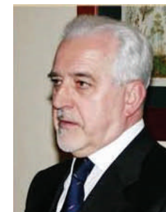
Dal 1980 è Medaglia d’Oro della Scuola, della Cultura e dell’Arte.