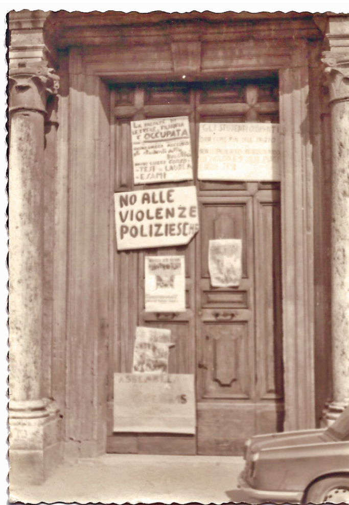
Il portone della Facoltà di Lettere occupata dagli studenti, 1968

Il lungo '68 in Italia e nel mondo. Cosa è stato, cosa resta